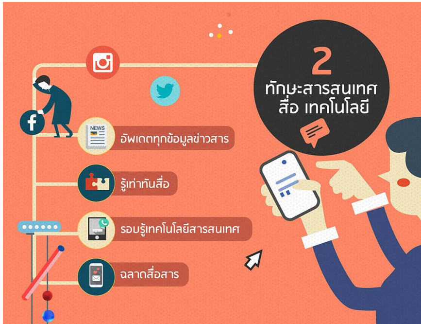
๓.๓ ทักษะชีวิตและอาชีพ