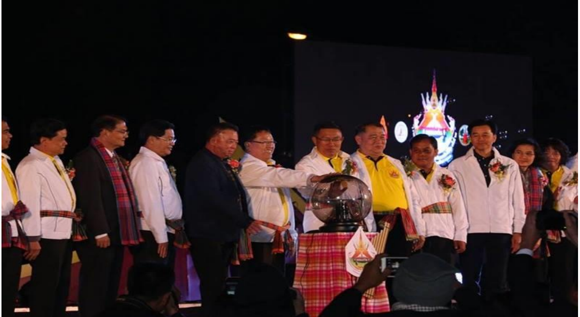
จุดบริการภาคตะวันออกเฉียงเหนือ

ศิลปหัตถกรรมภาคตะวันออกเฉียงเหนือ ในวันที่ ๒๐ ธันวาคม ๒๕๖๐ นี้ ซึ่งวันนี้ไม่ได้มีแต่ภาคตะวันออกเฉียงเหนือเท่านั้นที่จัดงานศิลปหัตถกรรมนักเรียน ยังมีของภาคใต้ด้วยที่จัดงานในวันนี้ ซึ่งท่านเลขาธิการสพฐ. จะไปเยี่ยมชมการจัดการศิลปหัตถกรรมนักเรียนภาคใต้ในวันที่ ๒๑ ธันวาคม ๒๕๖๐ และขอขอบคุณจุดบริการการเดินทางร่วมการแข่งขันงานศิลปหัตถกรรมนักเรียน ของทั้งภาคตะวันออกเฉียงเหนือและภาคใต้ด้วย